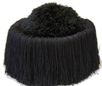
Fig. 4.- Birrete de Rector.

La medalla de la Real Academia de Doctores de España tiene el birrete entre sus símbolos preferentes, junto al libro y los guantes (Fig. 6), y aunque no es un recurso frecuente, el