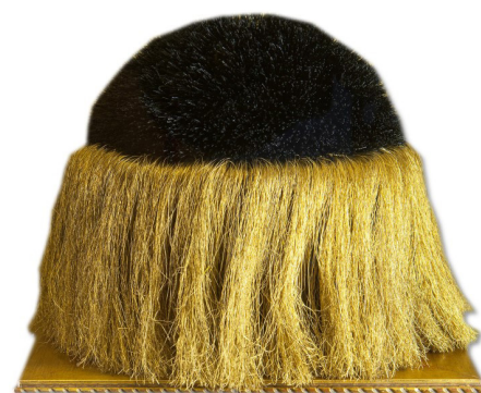
Fig. 5.- Birrete de Gran Canciller en las Universidades privadas de la Iglesia.