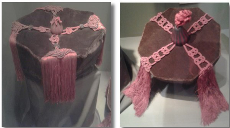
Fig. 8.- Birretes de la especialidad en Jurisprudencia utilizados en la Universidad Mayor de la República de Uruguay en el momento de su fundación en 1849. El birrete se complementaba con un fagín de los mismos colores.