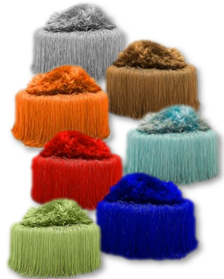
Fig. 1.- Birretes de Doctor de varias especialidades que se imparten en la Universidad de León. Desde delante hacia atrás, Veterinaria, Ciencias, Derecho, Filosofía y Letras y Ciencias de la Educación, Ciencias Económicas, Ingenierías y Ciencias de la Salud.