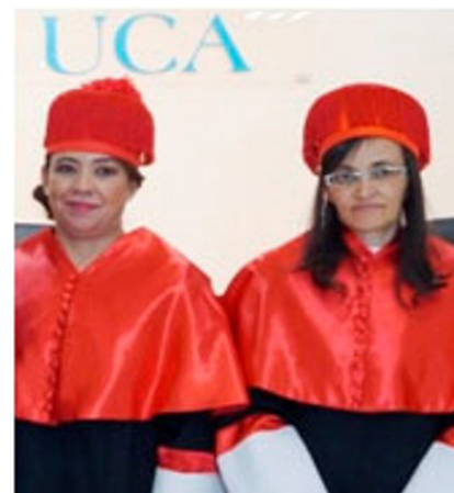
Fig. 10.- El birrete laureado utilizado en la Universidad Centroamericana de Nicaragua tiene muy pocas diferencias con el utilizado en la universidad española.

La Universidad Centroamericana de Nicaragua, creada en 1960, utiliza también como símbolo del doctorado el birrete con forma y distribución similar a la de las universidades españolas, con la variante de que el gorro es más alto y no es negro, sino del mismo color que la borla y los flecos no terminan en el borde del armazón dejando ver una banda del mismo (Fig. 10) 5 .