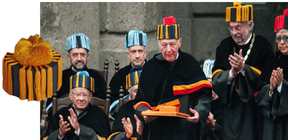
Fig. 9.- El birrete octogonal forma parte del traje académico de la Universidad Nacional Autónoma de México (UNAM).

cocónica de la que parten cuatro alamares en filigrana trenzada de cordones de color granate que terminan en flecos que cubren la anchura de cuatro lados alternos del birrete.