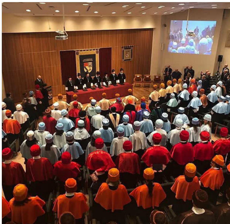
Fig. 11.- Aunque en el traje académico de los docentes de la Universidad Panamericana de México hay algunas diferencias en la toga y la muceta, el birrete es igual al de los doctores de las universidades españolas.

La Universidad Panamericana de México, fundada en 1967 como una escuela de negocios, con orígenes en el Instituto Panamericano de Alta Dirección de Empresa, utiliza una vestimenta académica prácticamente igual al utilizado en las universidades españolas. Adoptan la expresión de birrete con ínfulas como distintivo de los que poseen el título de doctor, junto con las puñetas de encaje (Fig. 11) 6 .