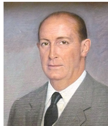
Fig. 2.-El genealogista y cronista Rey de Armas don Vicente de Cadenas y Vicent asesoró a la Universidad de León en la composición de su escudo institucional 13 .

Ante las múltiples opciones surgidas, la Comisión acordó contactar y solicitar asesoramiento al genealogista y cronista Rey de Armas don Vicente Francisco de Cadenas y Vicent (1915-2005) (Fig. 2), al que se enviaron varios bocetos que trataban de reflejar las ideas fundamentales que deberían quedar bien explicitadas en el escudo, con la finalidad de que valorara las propuestas y marcara pautas definitivas. Entre esos símbolos se sugerían: el emblema heráldico de León, la transmisión de la Universidad de Oviedo a León (representada por las armas de la cruz de la Victoria y de Ramiro II) y si fuese posible algún motivo alegórico a la ubicación de la Universidad (Locus Apellationis) o al patronazgo