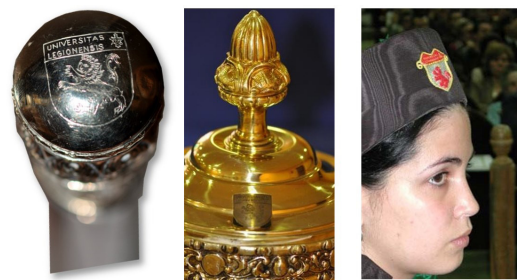
Fig.11 .- La vara del Maestro de Ceremonias y la maza institucional conservan el escudo original. El gorro del abanderado y los maceros, de la misma época, lucen un escudo de boca excepcional.