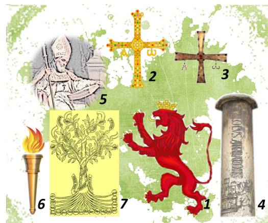
Fig. 3.-Recreación de las ideas propuestas por la Comisión para reflejar en el escudo: Emblema heráldico de León (1); Trasmisión de la Universidad de Oviedo a León (2 y 3); Ubicación de la Universidad (4); Patrono (5); En la Universidad se hace ciencia (6 y 7).