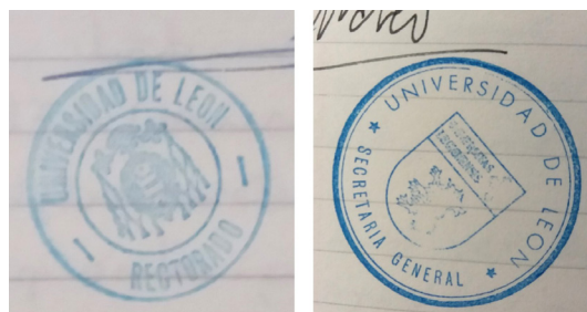
Fig. 10.- Sello institucional anterior y posterior a la aprobación del escudo de la Universidad de León por la Comisión Gestora.