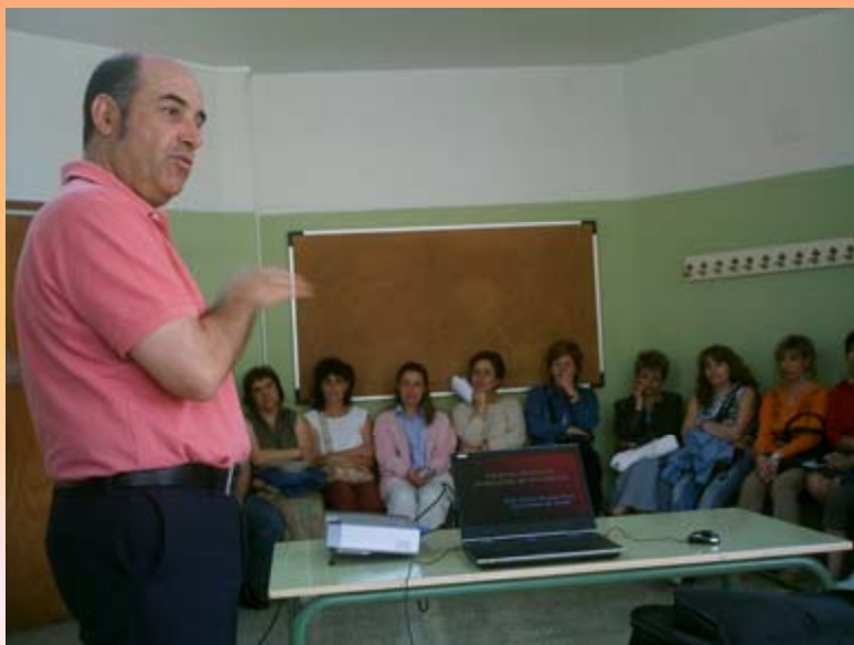
Jornadas de Formación Conjunta Familias-Profesorado