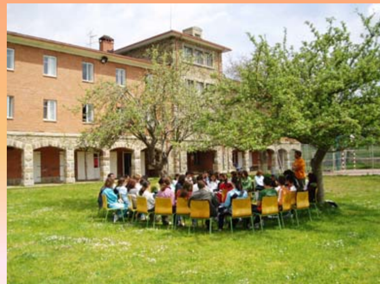
Formación en Mediación Escolar Conjunta con otros Centros