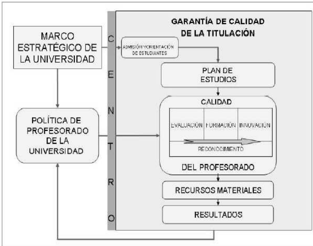
Ilustración 2. Evaluación del profesorado en el marco de un Sistema de Garantía de la Calidad.