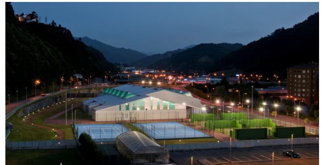
Vista del Complejo Deportivo de Mieres