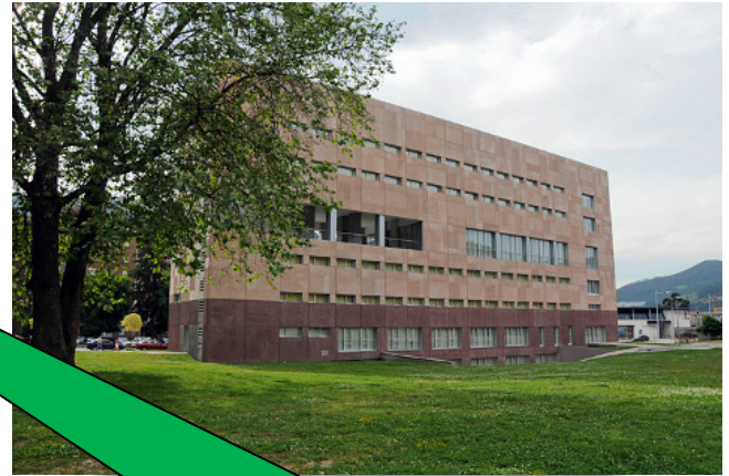
Residencia Universitaria de Mieres